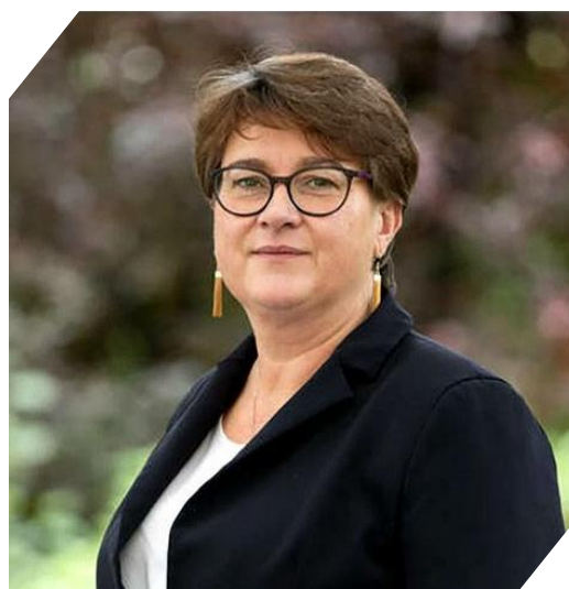
Karine DELAMARCHE : Préfète, directrice de cabinet du préfet de la région Ile-de-France, préfet de Paris