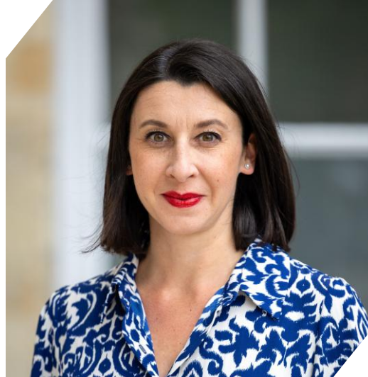
Sophie LAGOUTTE : Ambassadrice de France en Azerbaïdjan