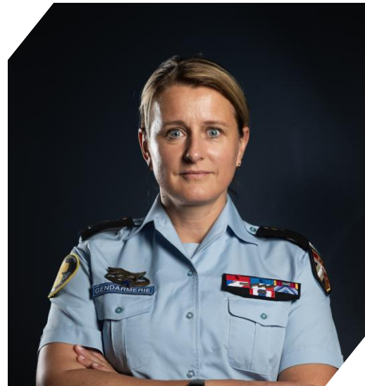
Florence GUILLAUME : Commandante de la région de gendarmerie du Grand-Est, commandant de la gendarmerie pour la zone de défense et de sécurité Est