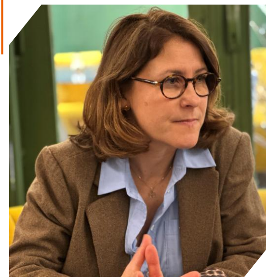
Christelle BOUCHER-DUBOS : Directrice générale de l'agence régionale de santé Corse