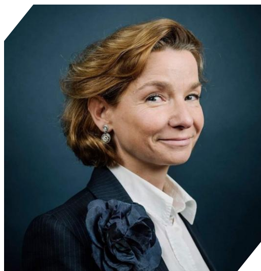
Aurélié ROYET-GOUNIN : Ambassadrice de France au Rwanda