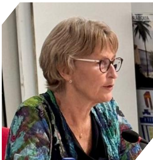
Valérie DEBUCHY : Rectrice de la région académique de Mayotte, rectrice de l'académie de Mayotte