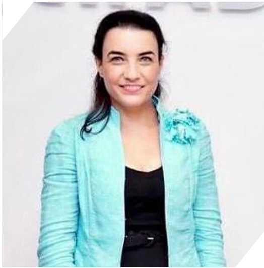
Céline JURGENSEN : Représentante permanente de la France auprès de l'Office national des Nations Unies à Genève