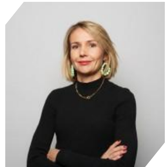
Elise BAS : Préfète, secrétaire générale pour l'administration de la préfecture de police