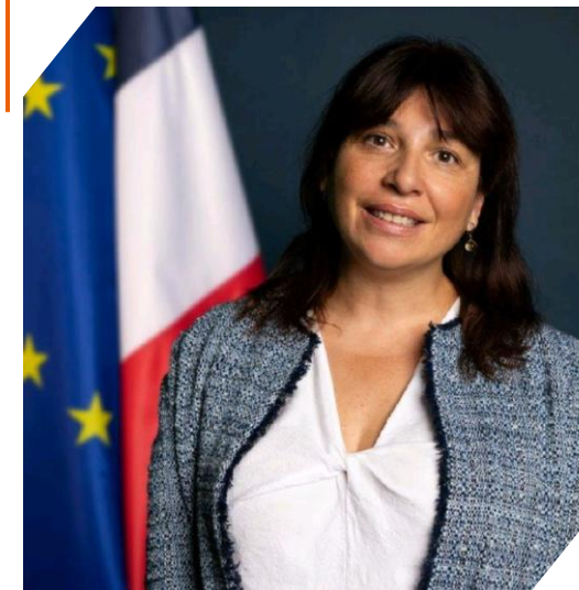
Fabienne RUNYO : Ambassadrice de France en Slovénie