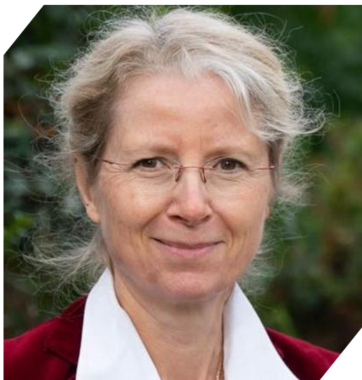
Valérie BADUEL-THIEBAUT : Vice-présidente du Conseil général de l'alimentation, de l'agriculture et des espaces ruraux