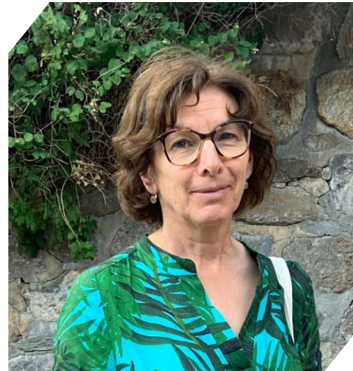
Chantal MAUCHET : Préfète de l'Hérault