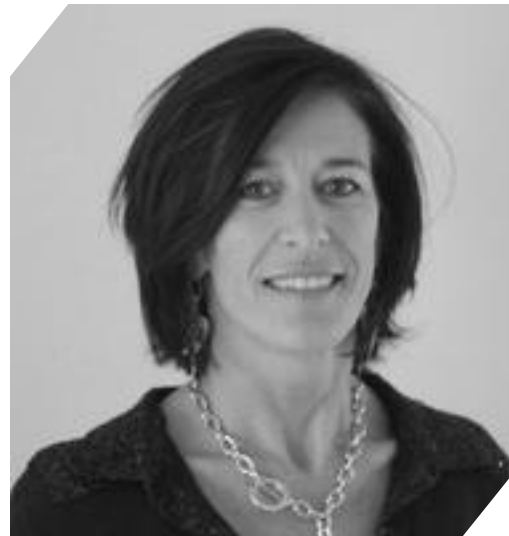
Virginie DUPONT : Rectrice de l'académie de Clermont-Ferrand