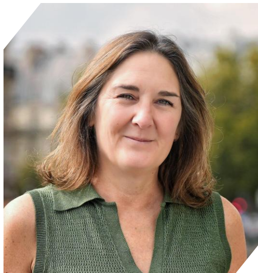
Estelle BALIT : Déléguée interministérielle à la sécurité routière et déléguée à la sécurité routière