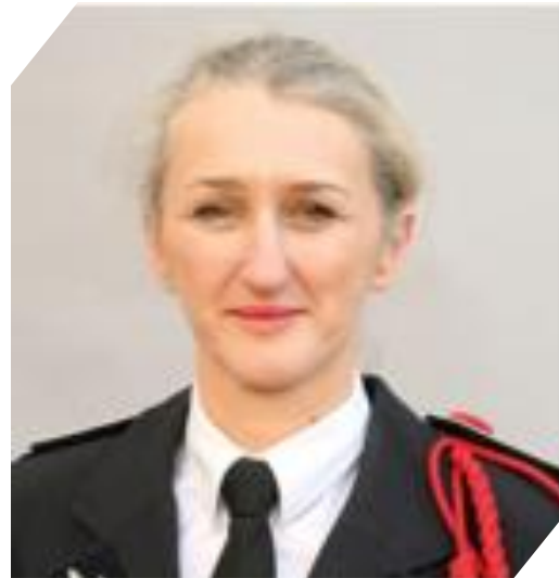
Isabelle TOMATIS : Préfète des Alpes-de-Haute-Provence