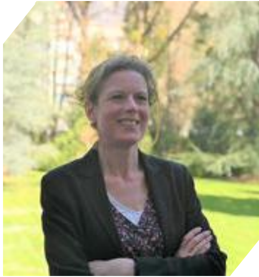
Emmanuelle DUBÉE : Préfète de la Haute-Savoie