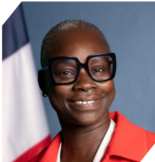
Diarra DIMÉ-LABILLE : Ambassadrice de France au Ghana