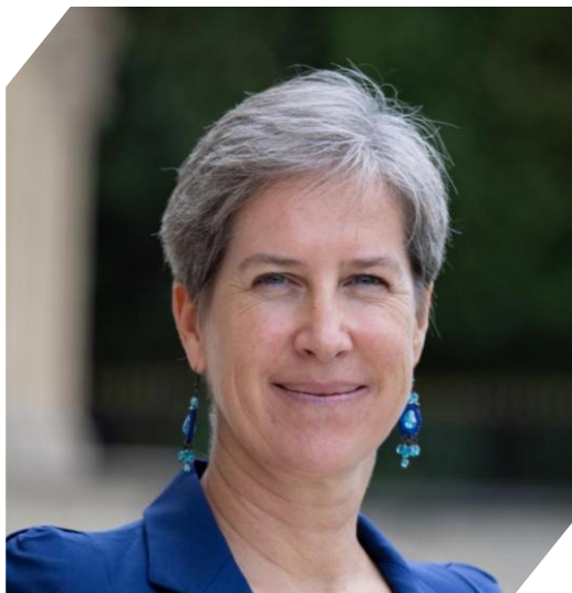
Virginie BIOTEAU : Ambassadrice de France en Uruguay