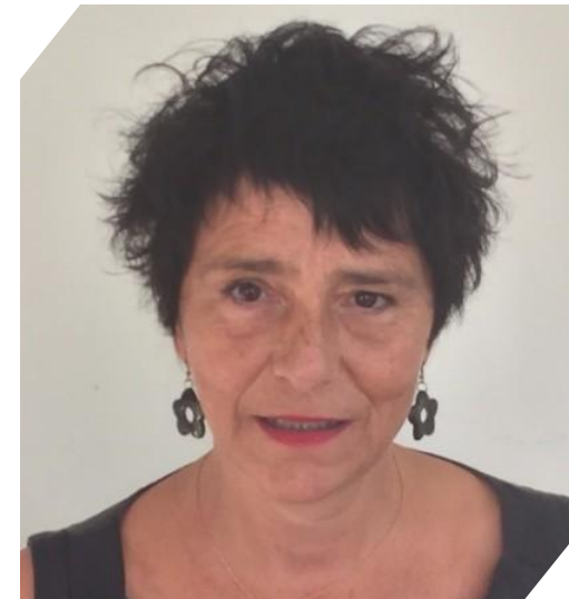
Hélène INSEL : Rectrice de la région académique Bretagne, rectrice de l'académie de Rennes