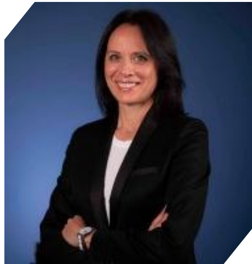
Valérie BARABAN : Ambassadrice de France au Botswana