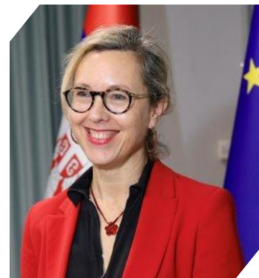
Florence FERRARI : Ambassadrice de France en Serbie