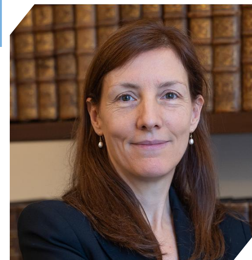
Fabienne BALUSSOU : Préfète de l'Essonne