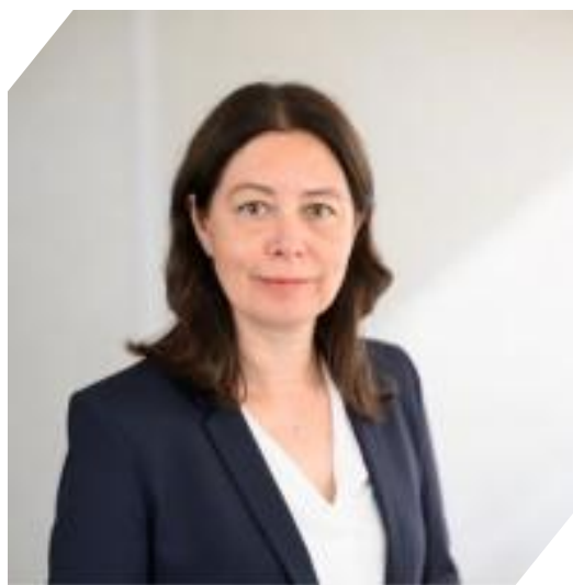
Lydie EVRARD : Directrice générale de l'Agence nationale pour la gestion des déchets radioactifs