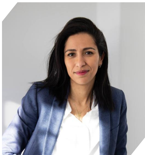
Sarah EL HAÏRY : Haute-Commissaire à l'enfance