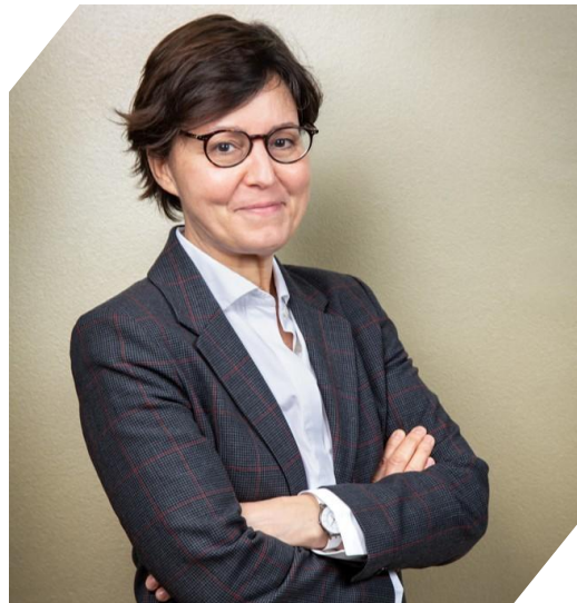
Virginie MAGNANT : Secrétaire générale des ministères sociaux